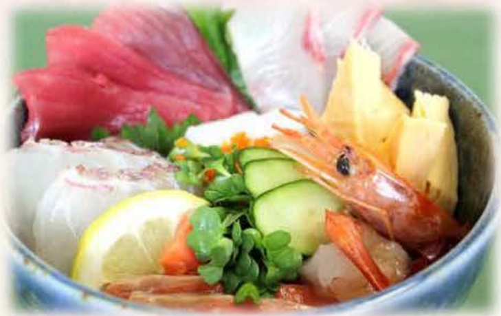
旬の 豪快 海鮮丼 (小鉢・汁物付) ¥1,680