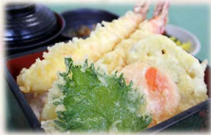
大海老 天重 (汁物・小鉢・香の物付) ¥1,480