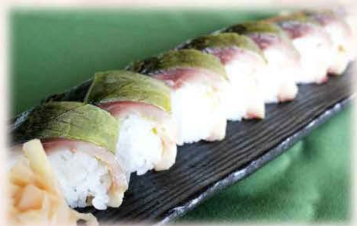
旬 鯖の棒寿司 (小鉢・御吸物付) ¥1,680